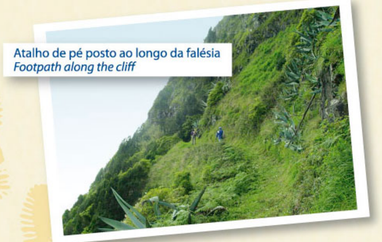
Atalho de pé posto ao longo da falésia Footpath along the cliff

PR2 SMA - Pico Alto - Anjos PRC3 SMA - Entre a Serra e o Mar