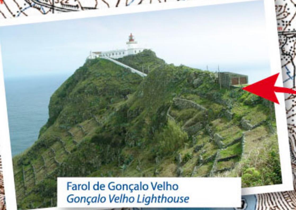
Farol de Gonçalves Gonçalo Velho Lighthouse