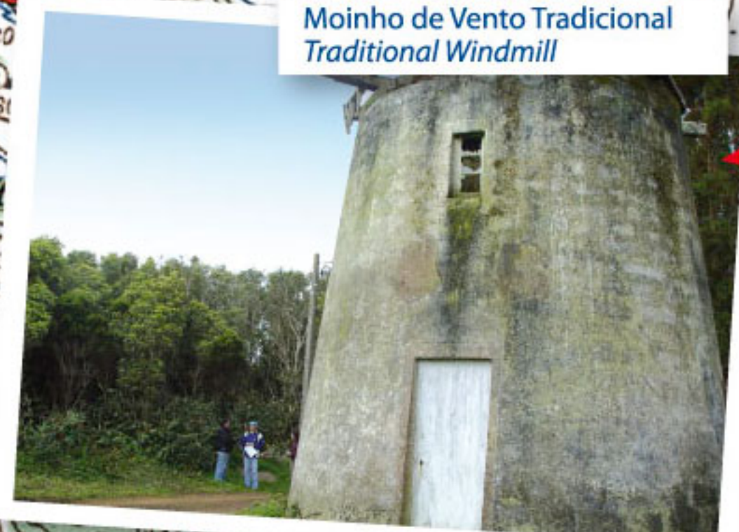
Moinho de Vento Tradicional Traditional Windmill