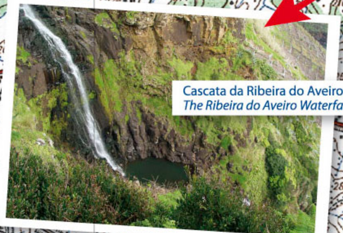
Cascata da Ribeira do Aveiro The Ribeira do Aveiro Waterfall