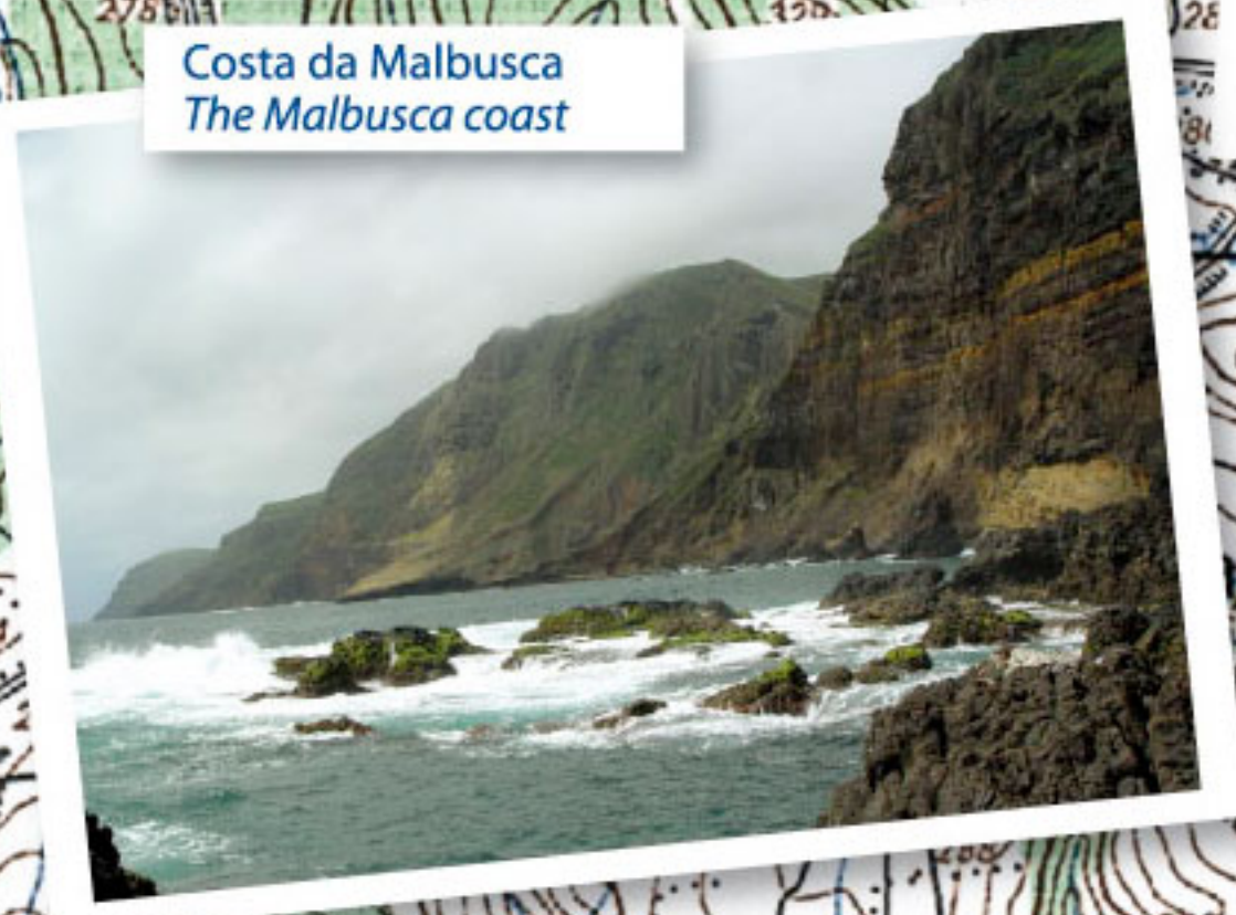
Costa da Malbusca The Malbusca coast